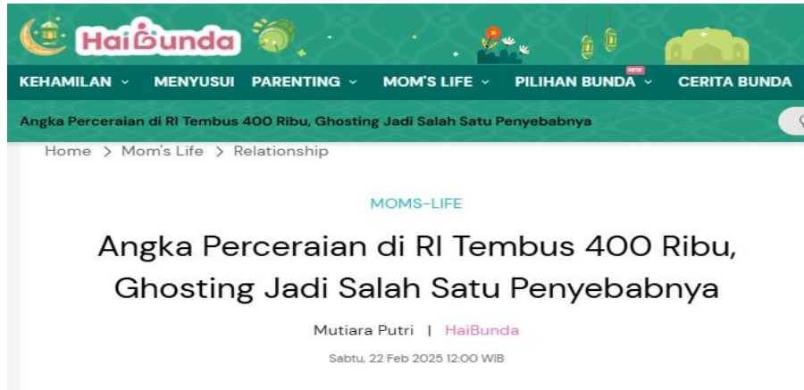
Gambar 1. Angka Perceraian di RI

Tingginya angka perceraian masih terjadi di Indonesia, Bunda. Sepanjang tahun 2024, angka perceraian di Tanah Air bahkan tembus sampai 408.347 kasus. Perceraian yang diajukan ini tentunya bukan tanpa alasan. Menurut Direktur Bina Ketahanan Remaja Kementerian Kependudukan dan Pembangunan Keluarga, Edi Setiawan, dua hal yang menjadi pemicu perceraian adalah perselisihan serta kekerasan dalam rumah tangga. Edi menjelaskan kepada wartawan bahwa angka perselisihan bisa mencapai angka 61,5 persen. Tidak hanya itu, adanya masalah ekonomi turut menyumbang sekitar 20 persen. "Ini fakta yang kita dapat dari Kementerian Agama, ternyata kasus cerai itu disebabkan karena sebagian besar pertengkaran dan perselisihan dalam keluarga sebesar 61,7 persen, memang ada masalah ekonomi seperempat atau 20 persen-nya," tandas Edi kepada wartawan, Jumat (21/2/2025). Perceraian dikaitkan dengan perilaku Ghosting . Ketika dirinci lebih lanjut, terdapat temuan menarik dalam kasus perceraian ini, Bunda. Ternyata, perilaku Ghosting turut dikaitkan dengan perceraian sehingga menyumbang angka sekitar 8,4 persen. Dalam laporan, Ghosting didefinisikan pada pihak yang ditinggal pergi tanpa adanya kabar dalam kurun waktu yang lama. Terbanyak kedua adalah kasus kekerasan dalam rumah tangga (KDRT) yakni sebanyak 1,3 persen. 21