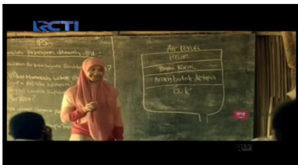
Gambar 4.4 Skema filter air bersih

Warga Dusun Derok memiliki masalah tentang pengadaan air bersih, banyak warga yang sakit perut karena mengkonsumsi air yang tidak sehat, perlu menempuh jarak yang cukup jauh untuk menemukan sumber air bersih, maka Aisyah berinisiatif mengajak siswanya untuk merubah air keruh menjadi air bersih, agar dapat dipakai bebersi dan dikonsumsi warga.