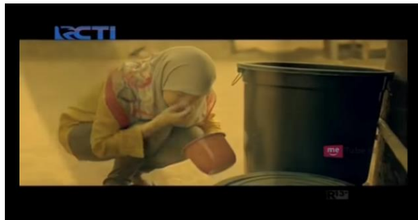
Gambar 4.7 Berwudhu

Sosok pemeran Aisyah, tidak pernah meninggalkan kewajibannya sebagai seorang muslim untuk melakukan salat.